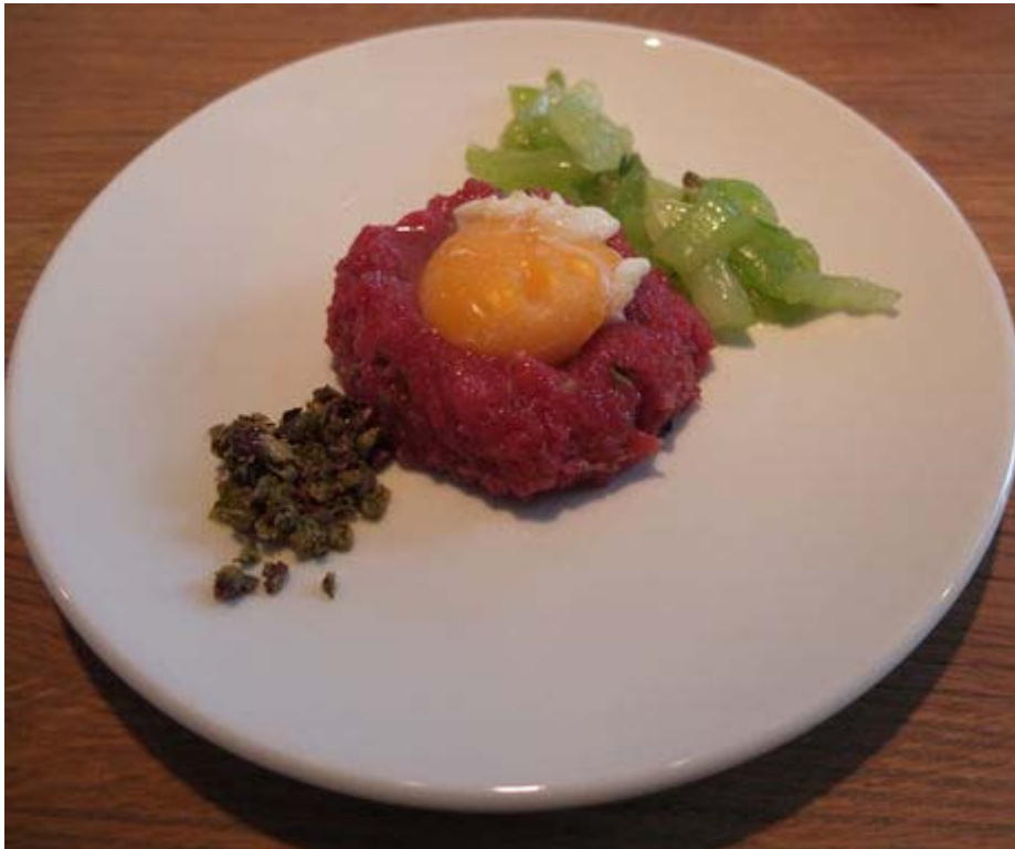
Beef Tartar mit

Kapern, Oliven und Pak Choi