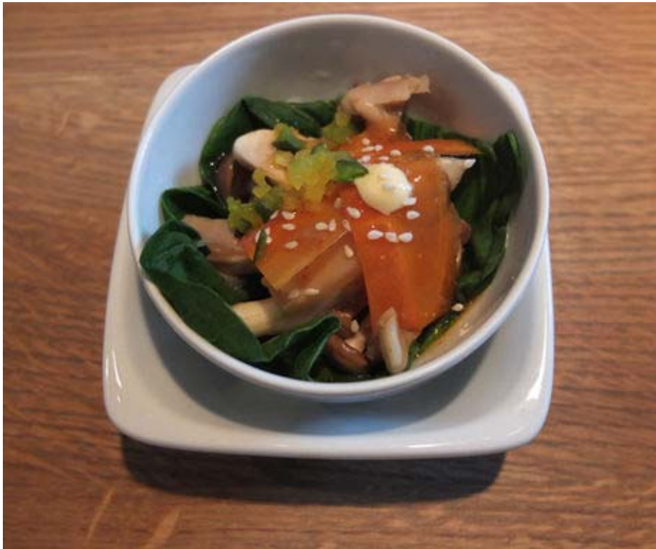
Marinierte Pilze in

Chili-Limone mit Sesam - Foto: Anita Kattinger